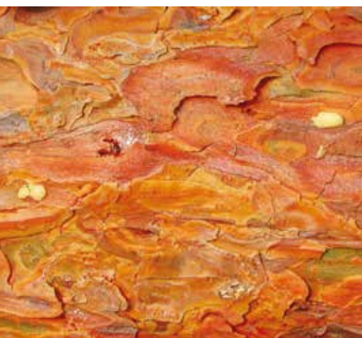
Pryskyřičné výrony v místech kladení pilořitky.