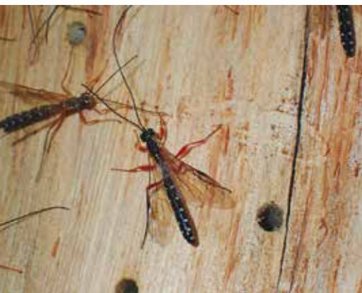
Lumci rodu Rhyssa na pilořítkou napadeném kmeni.

průměrné rychlosti 1,3 km.h -1 . Doletová vzdálenost jedinců napadených parazity je přibližně poloviční.