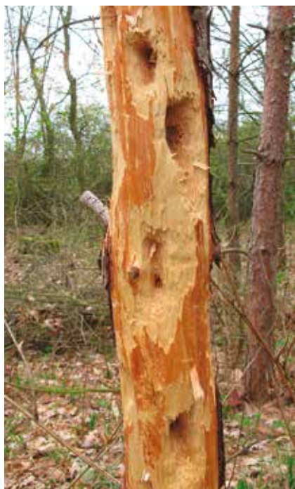
Neřímné symptomy napadení kmene pilořitkou (činnost datlovitých ptáků).