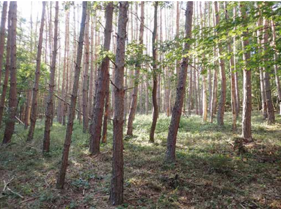
Silně napadený, pro výskyt pilořítek vhodný porost.