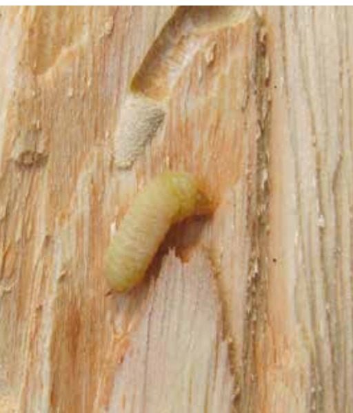
Larva a její požerek.

kázalo, že vyšší počty napadených stromů, stejně jako počty výletových otvorů, se nacházejí v klimaticky teplejších a sušších oblastech. Pilořitky preferují stromy zejména středních dimenzí, mnohdy podúrovňové (dosahující nejčastěji 50–80 % tloušťky stromů v porostu), a tedy konkurenčně slabší. Nejčastěji napadají stromy nekolonizované jinými druhy podkorního či dřevokazného hmyzu, v případě společného výskytu se jedná především o krasce borového ( Phaenops cyanea ) či lýkožrouta vrcholkového ( Ips acuminatus ).