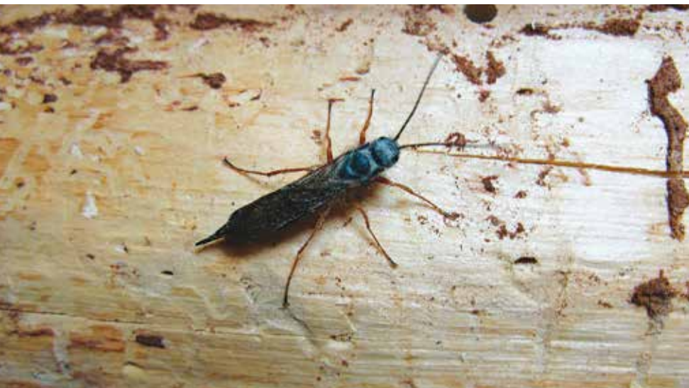
Samička na povrchu kmene