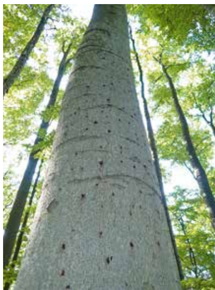
Stojící napadený kmen.

kteř by mohlo kůrovci bukovému sloužit k rozmnožení – polomy, vývraty, těžební zbytky, vytěžené dříví nebo silně oslabené stromy. V bukových porostech rovněž provádíme zdravotní výběr. Vše je třeba realizovat před začátkem a během rojení kůrovce bukového.