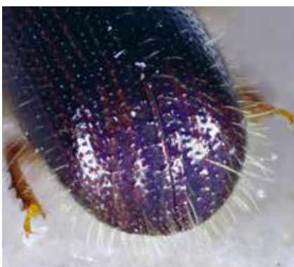
Dospělec kůrovce bukového – samice (zád'krovek).

i v bříze, dubu, habru, vrbě jívě, lísce a ořešáku. Kůrovec bukový napadá přednostně kmeny a větve pokácených nebo vyvrácených stresovaných buků, kde je často doprovázen dalším typickým zástupcem kůrovců korohlodem bukovým Eidophelus fagi (Fabricius, 1798). V některých případech napadá kůrovec bukový i stojící, zdravě vypadající buky, kde způsobuje praskliny v kůře, podkorní léze, a může tak ovlivnit i kvalitu dřeva. Tento sekundární škůdce je schopen urychlit proces odumírání chřadnoucích bukových porostů, které jsou k tomu náchylné (v důsledku stresu způsobeného suchem). Z tohoto důvodu jsou porostní stěny, porosty na extrémních stanovištích a porosty s nízkým zakmeněním nevhodnějšími lokalitami pro napadení kůrovcem bukovým. Zvýšený výskyt pravděpodobně souvisí s periodami sucha a chřadnutím bukových porostů. Přestože se zvýšila populace tohoto kůrovce a v zahraničí byla zaznamenána i silná přemnožení, např. v Maďarsku a na Slovensku, u nás dosud nedošlo k výrazným ekonomickým škodám. Lokálně byl pozorován jeho čtenější výskyt v oblasti Liberecka. Lze předpokládat, že v důsledku změn klimatu se může význam kůrovce bukového zvýšit a mohou vznikat i případné škody na bukových porostech.