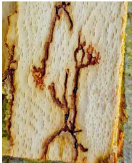
Požerek v lýku.