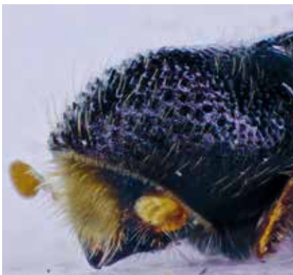
Dospělec kůrovce bukového – samice (čelo).