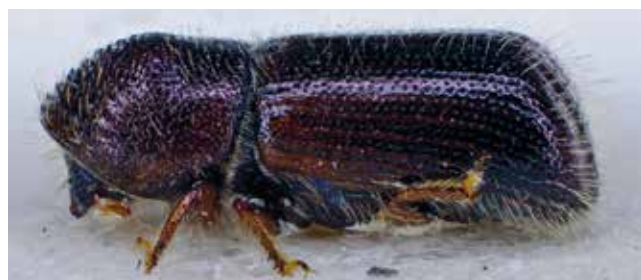
Dospělec kůrovce bukového – samec (boční pohled).