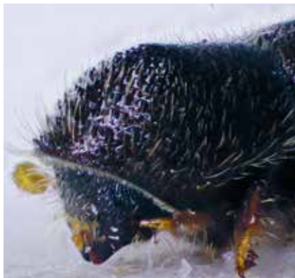
Dospělec kůrovce bukového – samec (čelo).