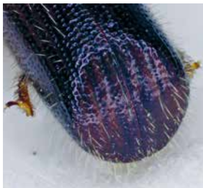
Dospělec kůrovce bukového – samec (zád'krovek).