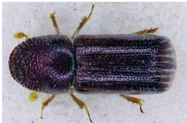
Dospělec kůrovce bukového – samec.

u nás všude, kde roste buk. V minulosti, do první poloviny 20. století, byl na území Čech poměrně vzácný, vyskytoval se hojněji na Moravě, ale postupně se rozšířil na celé území. Kromě buku je schopen se vyvíjet