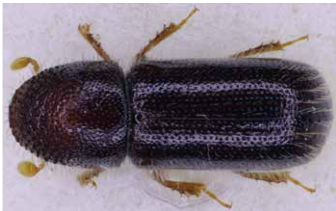
Dospělec kůrovce bukového – samice.