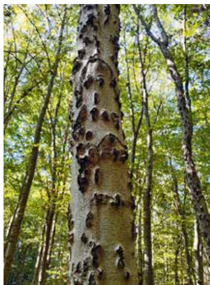
Silně poškozený přežívající strom po četném náletu kůrovce bukového.