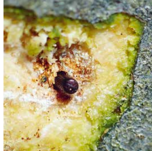
Samec v závrtovém otvoru.