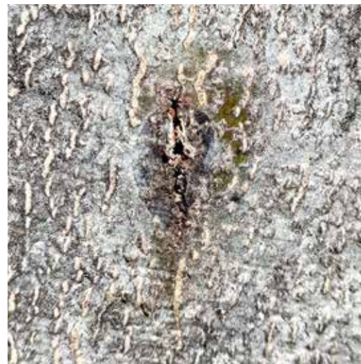
Černající mokvavá skvrna u závrtu.