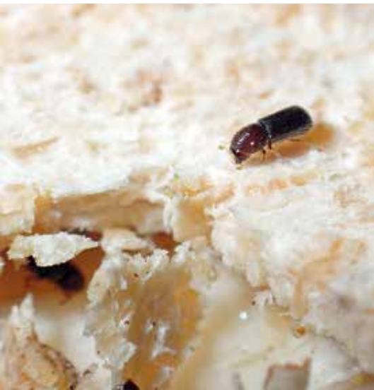
Samice kůrovce bukového při tvorbě požerku.