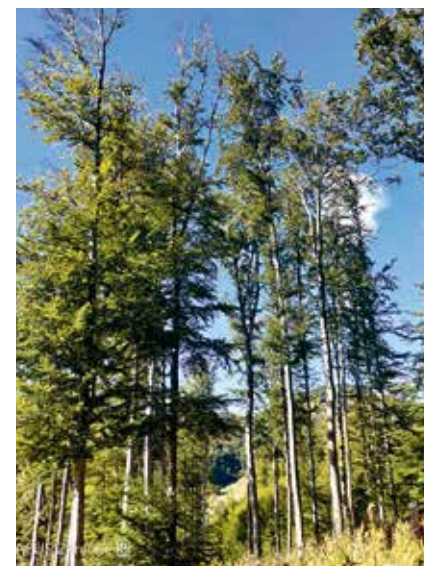
Prosychající koruny buků.