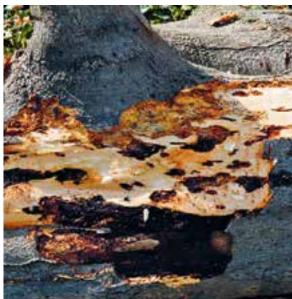
Černající mokravé léze pod kůrou u závrtu.

Vývojový diagram kůrovce bukového, termíny kontrolních a obranných opatření