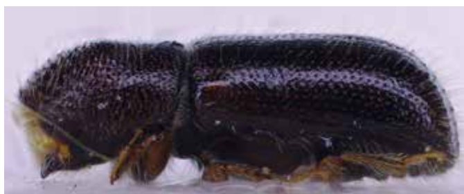
Dospělec kůrovce bukového – samice (boční pohled).