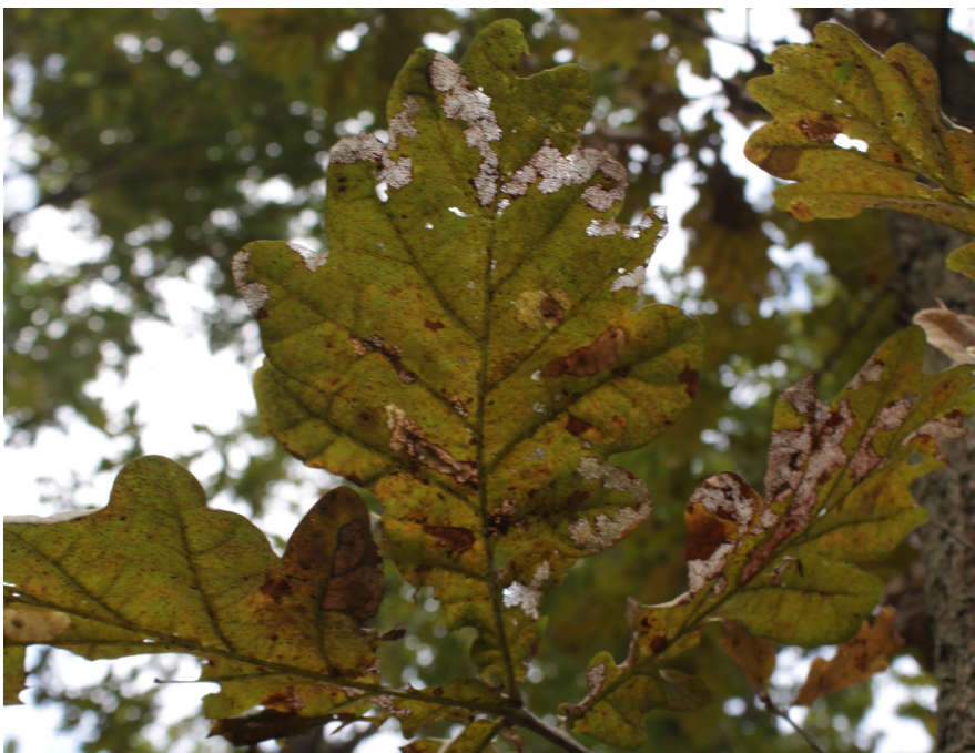
Sání sítňatek dubových způsobuje charakteristické žloutnutí listů.

dle dosavadních poznatků probíhá výhradně ve stadiu dospělce a přezimující nymfy nebyly v Evropě zaznamenány. Chladová odolnost sítňatek je poměrně dobrá. Uvádí se, že bez poškození přežívají krátkodobě i teploty kolem -20\text{ }^{\circ}\text{C} , dlouhodobě i delší vystavení teplotám do -5\text{ }^{\circ}\text{C} . Zimovací mikrohabitat ve formě opadanky, mechu či dokonce sněhové pokrývky může navíc působit jako izolační vrstva a vliv teplot pod bodem mrazu dále snížit. Ve výsledku tak evropské zimy populace sítňatek neohrožují.