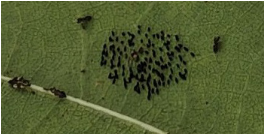
Snůšky se nachází na spodní straně listů a mohou obsahovat až 120 vajíček.