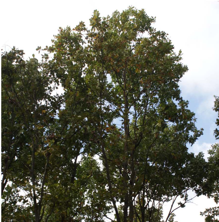
Porosty napadené sítnatkou dubovou jsou kvůli žloutnutí listů rozpoznatelné na velkou vzdálenost.

Za tímto účelem byla Lesní ochrannou službou testována metoda spočívající v injektáži kmene různými druhy látek s insekticidním či protipožerovým účinkem. Jejím principem je vpravení účinné látky pod tlakem přímo do vodivých pletiv hostitelské dřeviny. Výhodou oproti konvenčnímu postřiku je řádově nižší množství účinné látky potřebné pro ošetření jednoho stromu a delší trvanlivost, která dle typu přípravku dosahuje několika měsíců až let. Zásah zároveň posiluje přirozenou obranyschopnost stromu. Opakované odběry dubových listů na lokalitách na jižní Moravě potvrdily výrazně nižší výskyt sítnatek dubových na stromech ošetřených na jaře 2025 i v roce 2024 oproti neošetřené kontrole. Nejvyšší účinnost vykazovaly varianty se syntetickými insekticidy, ale velmi dobrých výsledků dosáhly i některé přírodní rostlinné extrakty běžně užívané v potravinářství či kosmetice. Metoda za-