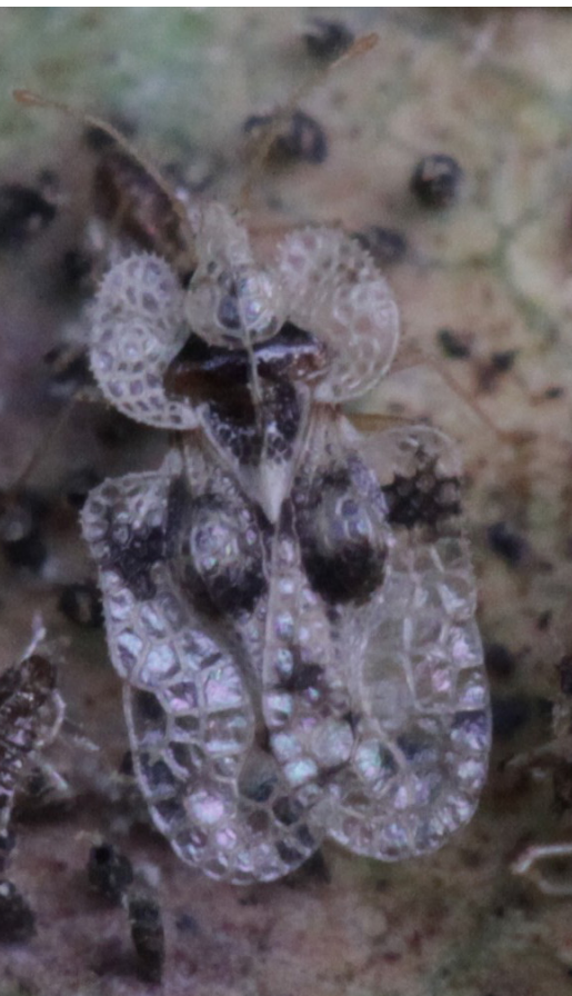
Dospělci sítnatky dubové mají polokrovky připomínající krajku.

užit přípravky na přírodní bázi, které se rychleji rozkládají ve vnějším prostředí a nezanechávají rezidua v půdě.