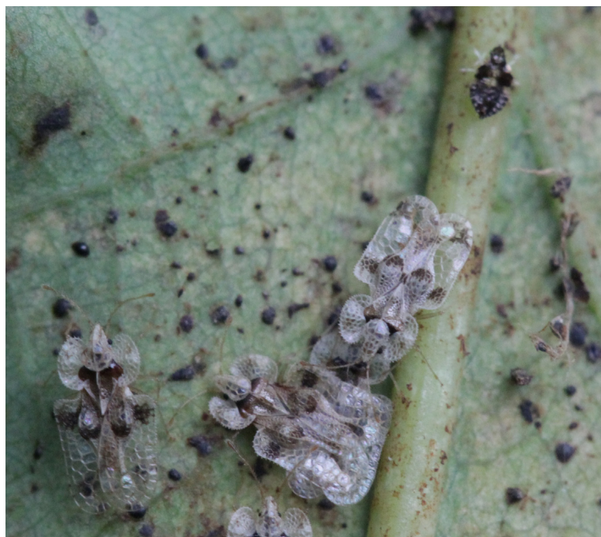
Dospělci a nymfy sítnatky dubové sají na spodní straně listů.

65% úmrtnost sítnatek dubových během přezimování. Většina jedinců uhynula v důsledku infekce houbou Beauveria pseudo-bassiana , která prokázala vysokou účinnost i v následných laboratorních testech (Kovač et al. 2021). Chemická ochrana zahrnuje především postřik schválenými typy insekticidních přípravků, což připadá v úvahu hlavně ve školkách. V některých zemích EU