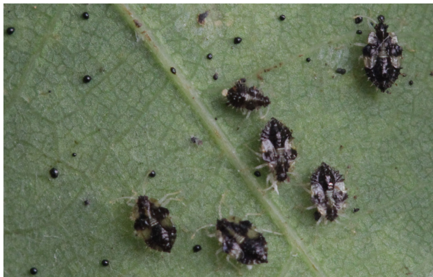
Nymfy jsou černě zbarvené, u starších instarů jsou patrné bílé skvrny.

Stejně jako u mnoha dalších druhů škůdců jsou také u sítnatky dubové uplatňovány zejména metody biologické a chemické ochrany. Z první jmenované skupiny je třeba zmínit především aplikaci přípravků na bázi entomopatogenních hub. V jižní Evropě byly charakterizovány druhy entomopatogenních hub, které způsobily více než