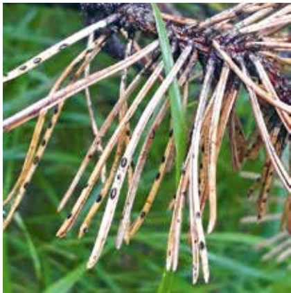
Skulinatec borový na borovici kleči, symptomy a plodnice.