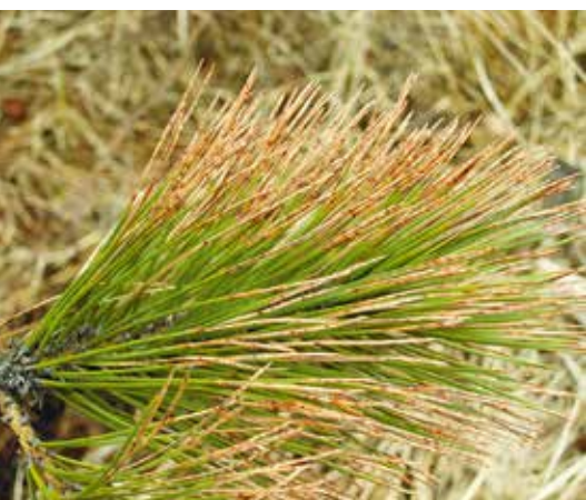
Červená sypavka na borovici lesní.