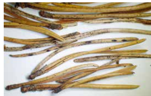
Skulinatec borový na borovici blatce, symptomy.