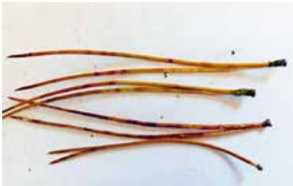
Cyclaneusma minus na jehlicích borovice černé, symptomy.