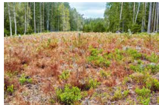
Skulinatec borovicový na sazenicích borovice lesní.

ci jehlic dochází na začátku léta. Příznaky se začínají objevovat koncem léta: barevné změny a příčné tmavé pruhy na jehlicích. Obvykle je napadena jen jedna jehlice ve svazečku. Pohlavní plodnice se vytvářejí až na jaře, askospory v nich dozrávají v polovině června.