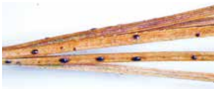
Meloderma desmazieri na borovici vejmutovce, plodnice.

M. desmazieri prorůstá jehlicemi do větévek, takže neodumírají jen jehlice, ale celé výhony, resp. části větévek. Jehlice neopadávají, zůstávají (rezavě hnědé) i s dokonale vytvořenými plodnicemi na stromě. Pokud se nákaza opakuje více let za sebou, strom postupně přichází i o veškeré jehličí a odumírá. Uhnout mohou nejen mladé, ale i odrostlé vejmutovky (i ve věku několika desítek let). Nejvyšší riziko hrozí v místech s vysokou vlhkostí.