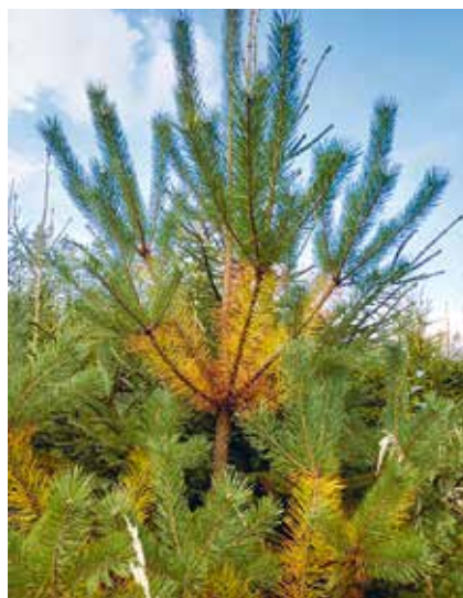
Přirozená senescence na borovici lesní.

V češtině jsou houboví původci sypavek tradičně nazýváni totožně jako onemocnění,