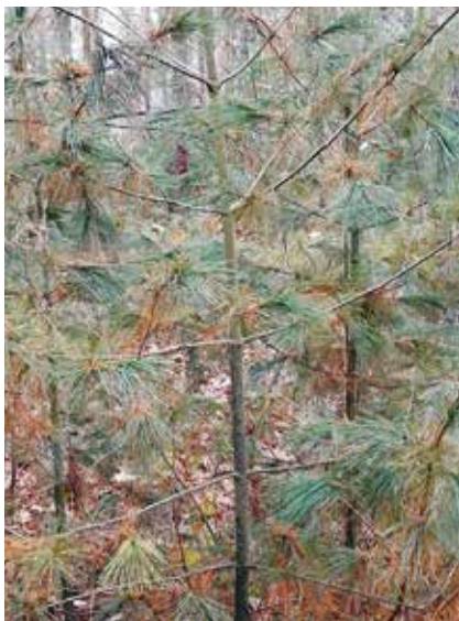
Meloderma desmazieri na borovici vejmutovce, symptomy.