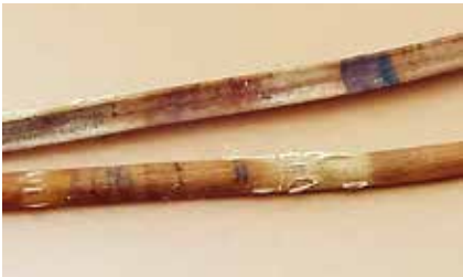
Cyclaneusma minus na jehlici borovice černé, symptomy a plodnice.