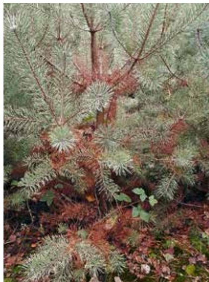
Skulinatec borový na borovici lesní, symptomy.

mem jehlice není na povrchu jehlice viditelné. Apothecia vznikají až v průběhu dalšího vegetačního období, kdy na podzim a v zimě následuje opad jehlic. Záměna je možná se senescencí jehlic, kuželíkem borovým ( Sphaeropsis sapinea , syn. Diplodia sapinea ) či s ostatními původci houbových sypavek, především v počáteční fázi napadení. Cyclaneusma niveum je velmi podobná, tvoří o něco větší plodnice a vyskytuje se hlavně v jižní Evropě.